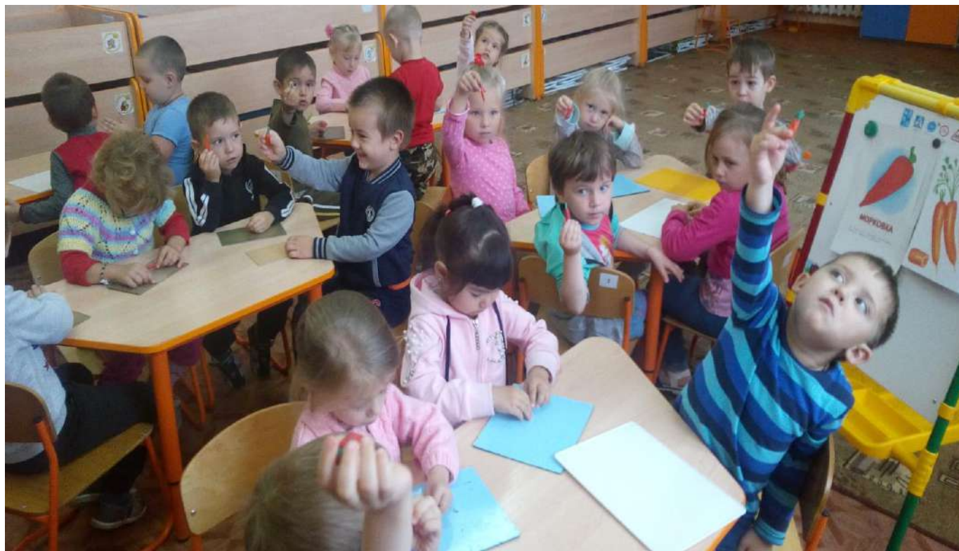
«РЫБКА ДЛЯ КОТЯТ»